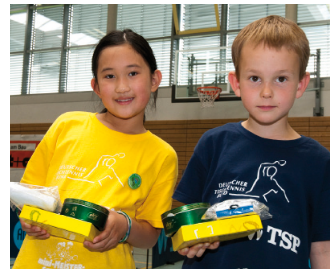
Auszeichnung für Fairplay

Kontinuierliches Training in einem Verein ist wichtig, wenn Tischtennis richtig erlernt werden soll. Es gibt zahlreiche Spiel- und Übungsformen, die viel Spaß machen. Im Verein erhält man qualifizierte Trainingseinheiten, um mit anderen Kindern spielerisch die verschiedenen Techniken einzuüben.